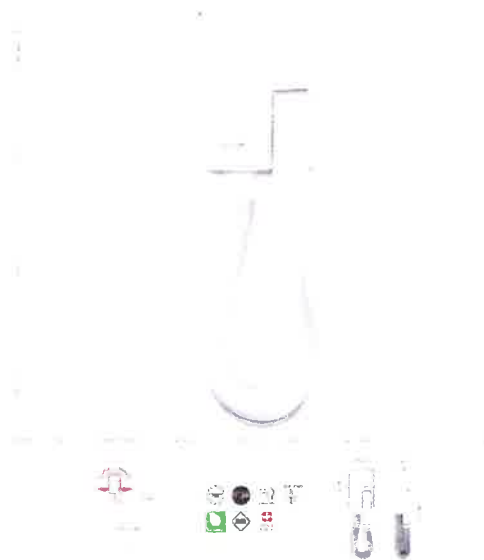
VALERA 832.01 T HOTELL White 1200W - hotelový fén s pripevnením na stenu - biely